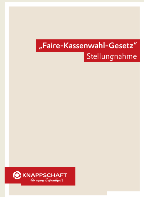
Positionspapier der KNAPPSCHAFT zur Weiterentwicklung des Morbi-RSA

Die KNAPPSCHAFT begrüßt den politischen Willen, Wettbewerbsverzerrungen abzubauen. Es ist jedoch unklar, ob Altersinteraktionsterme dieses Ziel unterstützen. So hält der Wissenschaftliche Beirat Altersinteraktionsterme zwar grundsätzlich für geeignet, rät allerdings dazu, Altersinteraktionen vor einer Einführung systematisch zu untersuchen. Diese