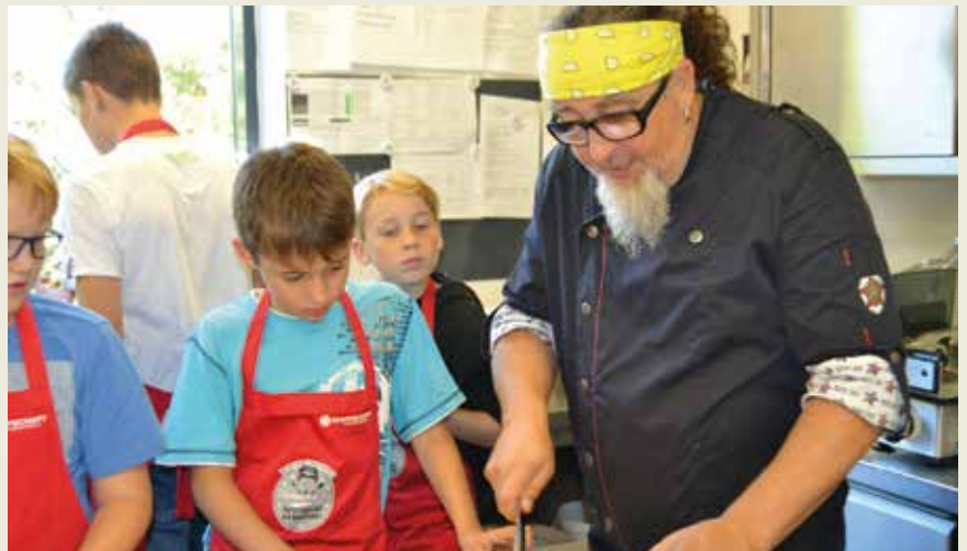
Sternekoch Stefan Marquard mit jungen Schülerinnen und Schülern in der Schulküche

Im Rahmen des Projektes „Sterneküche macht Schule“ mit Sternekoch Stefan Marquard greift die KNAPPSCHAFT das Thema „Gesunde Ernährung in der Schule“ auf und zeigt auf unkonventionelle Art, dass gesundes Mittagessen schmecken und Spaß machen