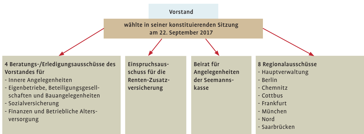
Abb. 3: Wen bzw. was wählt der Vorstand der KBS anlässlich der Sozialwahl 2017?

Die 62 Widerspruchsausschüsse für Sozialversicherungsangelegenheiten setzen sich aus jeweils zwei Vertretern der Versicherten und bis zu zwei