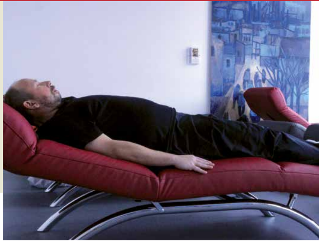
Entspannung zwischen den Therapien

Mehr Detailinformationen über unser Haus und zur medizinischen Rehabilitation erhalten Sie unter www.koellertal-klinik.de . Lernen Sie bequem von zu Hause aus unser Reha-Zentrum kennen