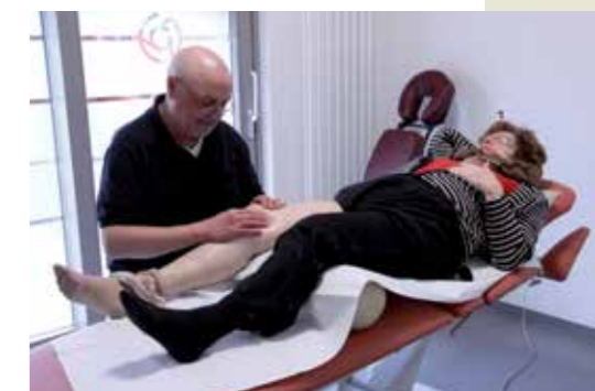
manuelle Therapie mit Gelenkersatz