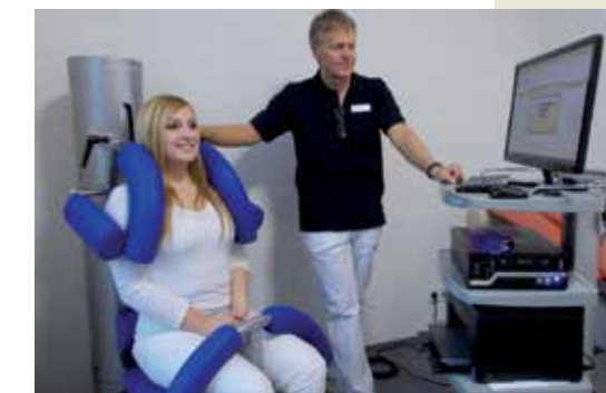
Dreidimensionale Vermessung der Wirbelsäule

Auf Wunsch bieten wir Ihnen eine individuelle psychologische Betreuung, in der Sie spezielle Entspannungstechniken und autogenes Training erlernen können. Abgerundet wird unser Angebot mit einer Sozialberatung sowie einem Nordic-Walking-Kurs.