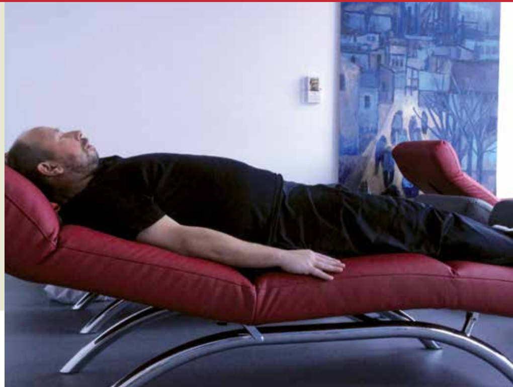
Entspannung zwischen den Therapien

Mehr Detailinformationen über unser Haus und zur medizinischen Rehabilitation erhalten Sie unter www.koellertal-klinik.de . Lernen Sie bequem von zu Hause aus unser Reha-Zentrum kennen