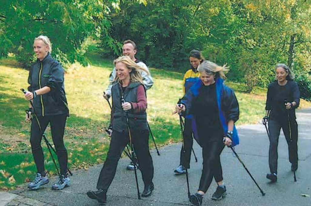
Nordic Walking hält fit