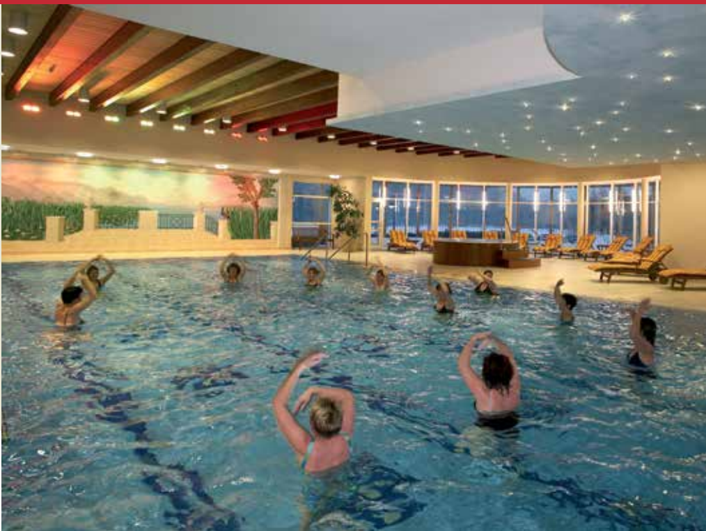
Entspannung im modernen Bewegungsbad

fühlbereich. In Verbindung mit den angebotenen Aromaduschen können Sie Ihre körpereigenen Abwehrkräfte reaktivieren. Die Wirkung von Wärme, Wasser und Licht trägt mit zu Ihrer Regeneration bei.